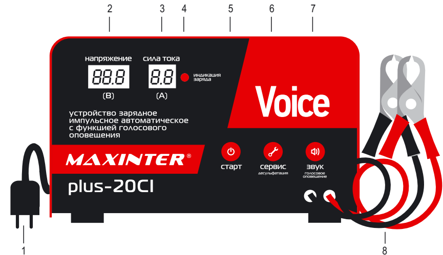
Рисунок 1. Общий вид зарядного устройства.